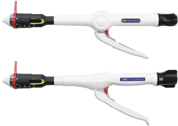
肛肠吻合器型号规格及尺寸表 单位:mm